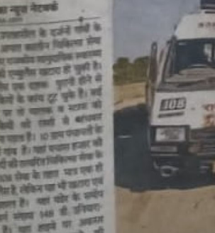
अनदेखी 50 हजार की आबादी की चिकित्सा व्यवस्था ढो रही खतरा एम्बुलेंस।