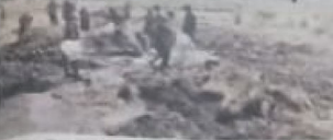
भीलवाड़ा में आग से मक्का की फसल स्वाहा।

भीलवाड़ा जिले में सुकान्हा की एक इलाके पर आग ने मक्का की फसल को जलवासा कर दिया।