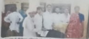
भीलवाड़ा में ईंधन चूल्हे का वितरण कार्यक्रम का शुभारंभ।