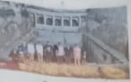
जिलेभर में आयोजन।