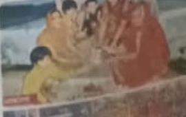
जिलेभर में आयोजन।

जिलेभर में आयोजन। देव उठे तो शहर से लेकर गांवों में मनाई छोटी दिवाली, शुरू हुई सावों की धूम, छूटे पटाखे।