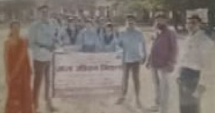
बनकाखड़ा में जल जीवन मिशन की रैली निकाली।