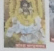
जिलेभर में आयोजन।