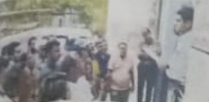
शराब ठेकेदार से मारपीट की निंदा, जापन सौंपा।

भीलवाड़ा में शराब ठेकेदार से मारपीट की निंदा, जापन सौंपा।